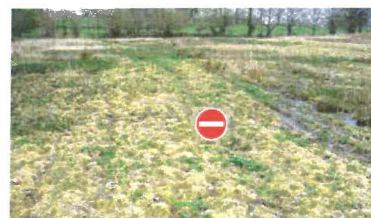
les sources, forages et puits