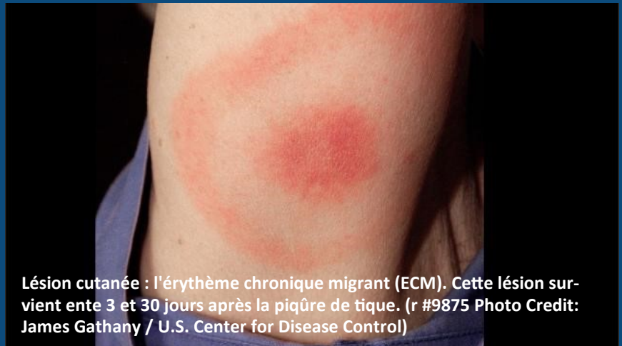
Lésion cutanée : l'érythème chronique migrant (ECM). Cette lésion survient entre 3 et 30 jours après la piqûre de tique. (r #9875 Photo Credit: James Gathany / U.S. Center for Disease Control)

prendre et prévenir la maladie de Lyme et les autres maladies provoquées par les agents pathogènes transmis par les tiques, notamment dans le cadre du projet de recherche CiTIQUE porté par l'Anses, l'Inra et l'Université de Lorraine. L'application peut être téléchargée sur les plateformes AppStore et PlayStore. »