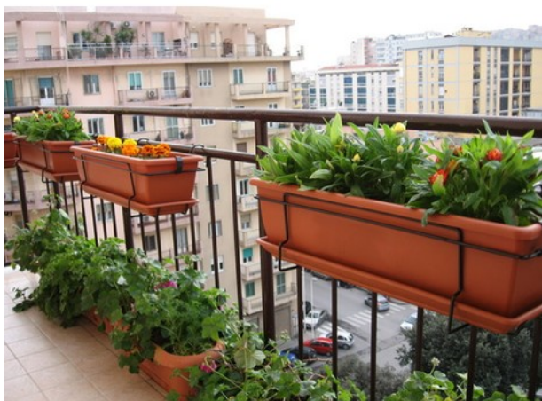
Les soucoupes ne manquent pas pour le Moustique tigre !

Il est par conséquent nécessaire de limiter leurs lieux de ponte pour éviter leur prolifération.