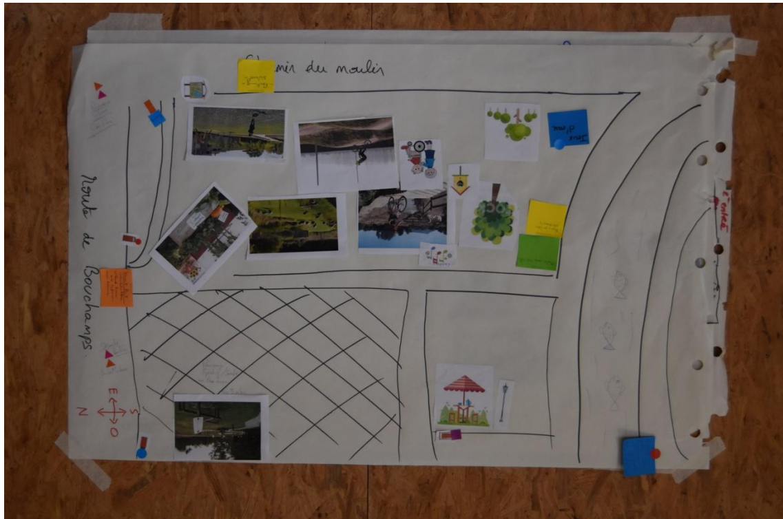
Figure 2 - zone humide