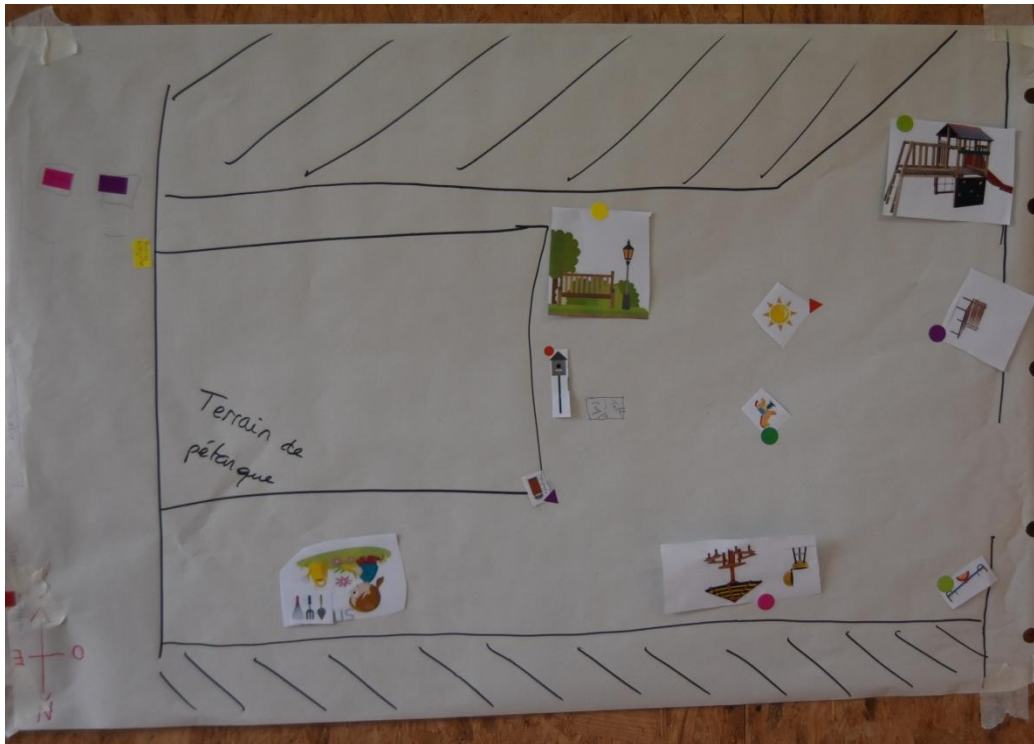
Figure 4 - Aire salle des fêtes