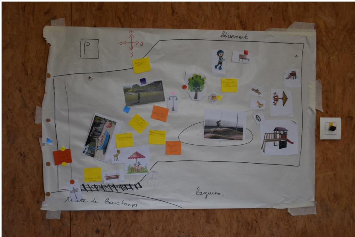
Figure 3 - Lotissement du Cormier